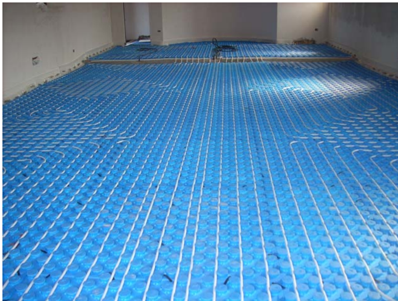
Chiesa di San Rocco -ROMA- Interventi di manutenzione straordinaria