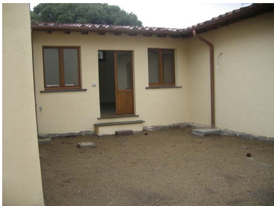
Monastero di S. Basilio SCV Albano (Rm) Ristrutturazione interna ed opere impiantistiche