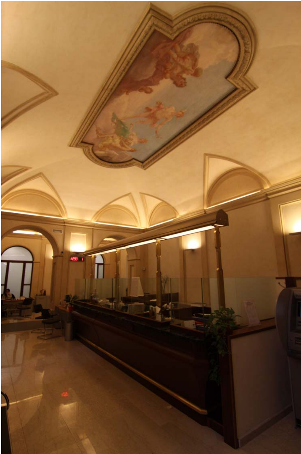
Edificio in Piazza Monte di Pietà n. 33 a -ROMA- Ristrutturazione della Agenzia Roma 80