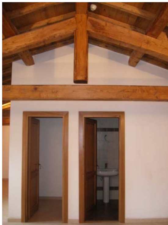
Monastero di S. Basilio SCV Albano (Rm) Ristrutturazione interna ed opere impiantistiche