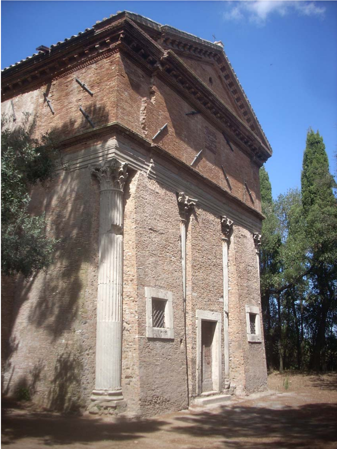
Chiesa di Sant'Urbano alla Caffarella