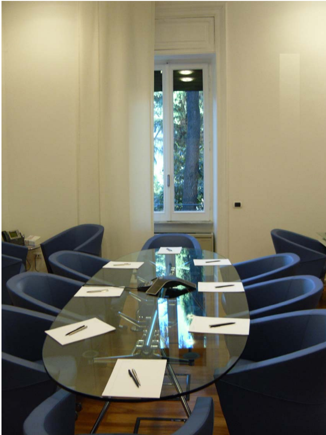
Uffici in via di Villa Sacchetti n. 11 -ROMA- Ristrutturazione dell'intero immobile