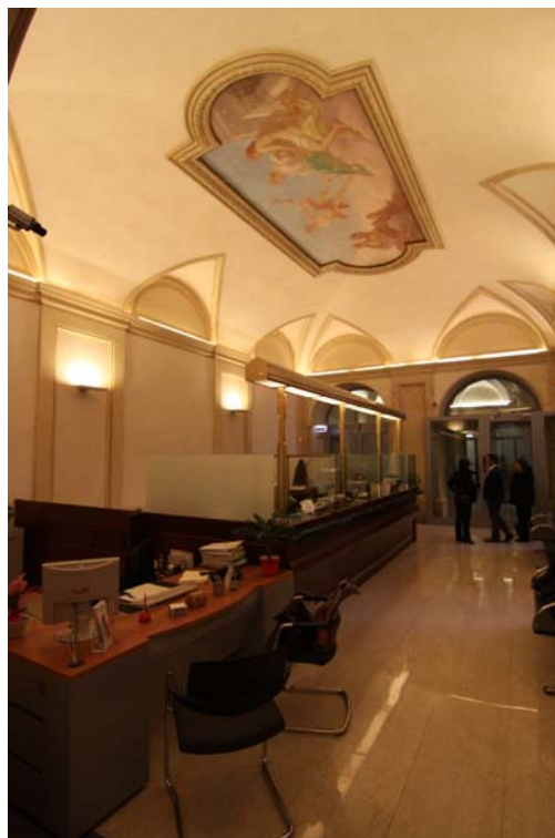
Edificio in Piazza Monte di Pietà n. 33 a -ROMA- Ristrutturazione della Agenzia Roma 80