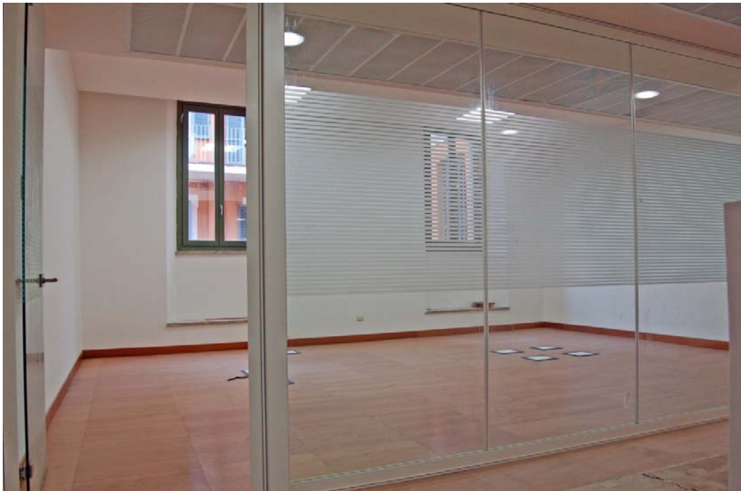
Palazzo del monte di Pietà -ROMA-