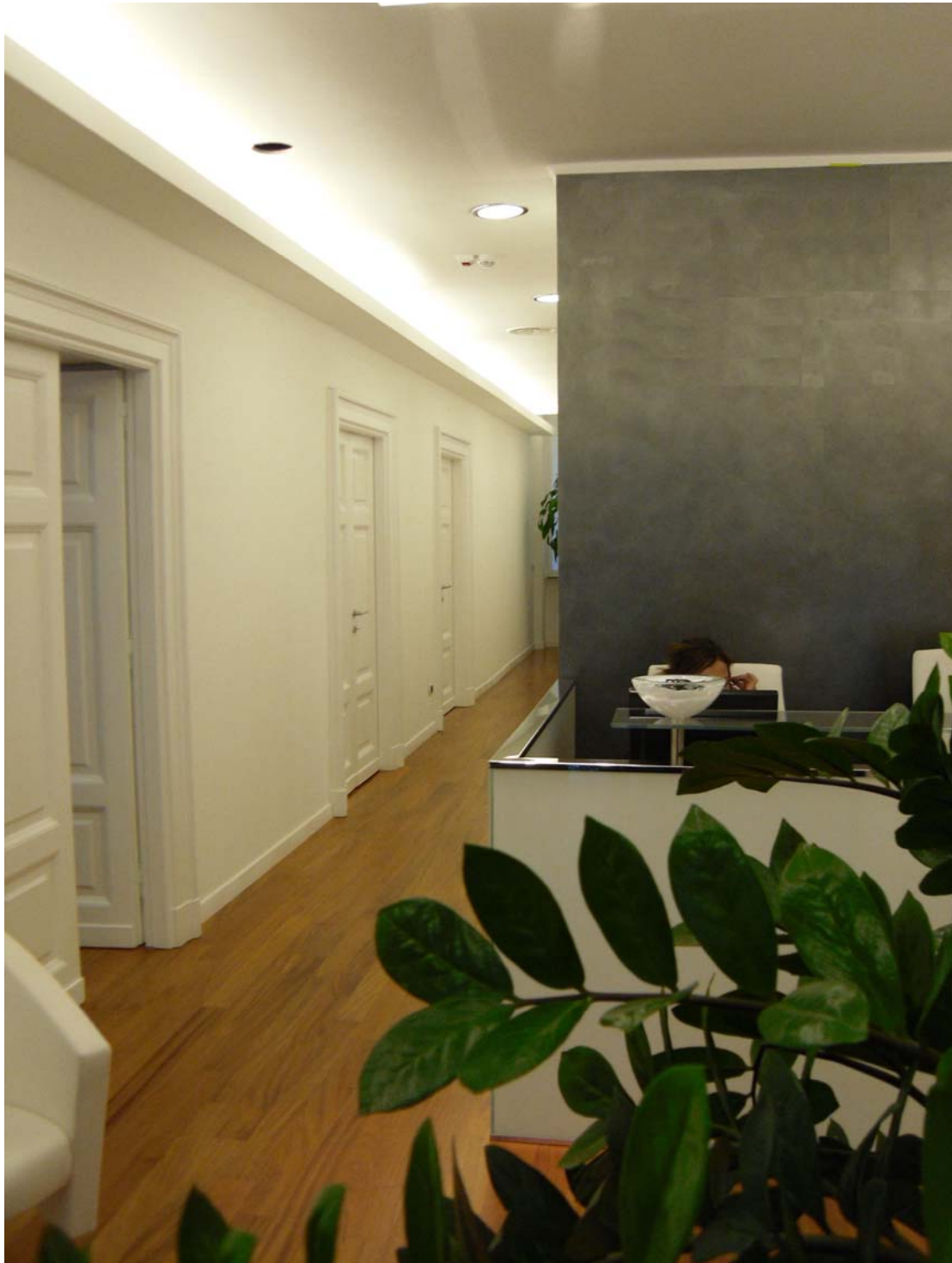
Uffici in via di Villa Sacchetti n. 11 -ROMA- Ristrutturazione dell'intero immobile